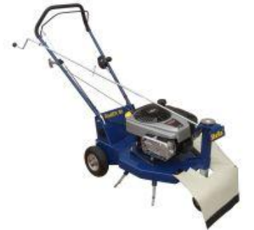
La brosse de désherbage

Nous rappelons aux habitants qu'ils ne doivent en aucun cas utiliser des désherbants et pesticides sur le domaine public.